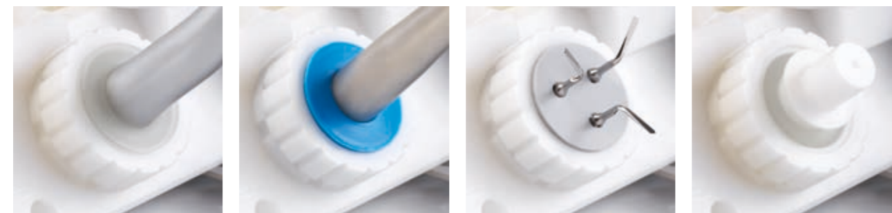
Adapter für Mikromotor-Handstücke Zur Behandlung von Mikromotor-Handstücken.